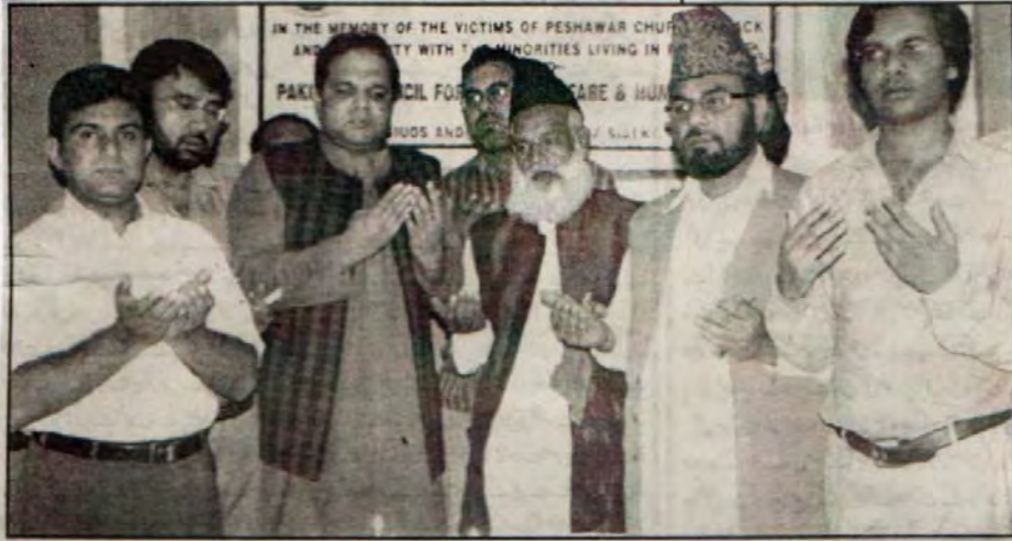
سیالکوٹ: پاکستان کونسل فار سوشل ویلفیئر اینڈ ہیومن رائٹس کے زیر اہتمام پشاور چرچ حملہ میں ہلاک ہونے والوں کی یاد میں دو گرجا سماج قریاں جلا کر دیا گیا ہے۔