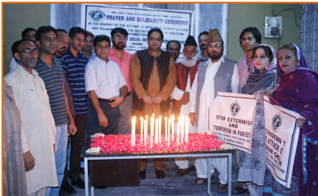
Participants of ceremony are protesting against the attack at Church after the lightning of candles during the Prayers and Solidarity ceremony

At the end of the ceremony candles were lighting in the memory of those innocent people died during the suicide attack at Church and also to show solidarity with the Christian community. Prayer was also offered for the departure soul of died people and prevailing of peace in Pakistan and throughout the world. The ceremony was published by the all National Newspapers and all TV channels highlighted this ceremony in their news bulletin.