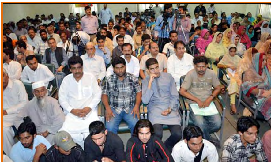
A view of participants during the ceremony

They further said that attack on a church was an act of terrorism and a conspiracy against Islam and Pakistan, Islam is religion of peace, justice, and teaches us the respect of all religions and their followers provides full protection to the minorities in Islamic state and there is no room for the blood shedding and prejudice with non Muslims in the name of religions. By promoting interfaith & intercultural harmony, social & religious tolerance, self respect we may eliminate the terrorism and extremism from Pakistan.