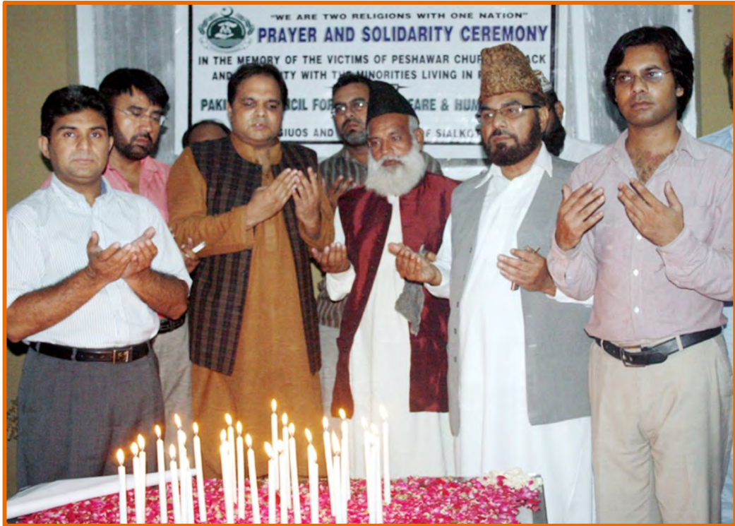
Prayers are being offered after the lighting of candles during the ceremony