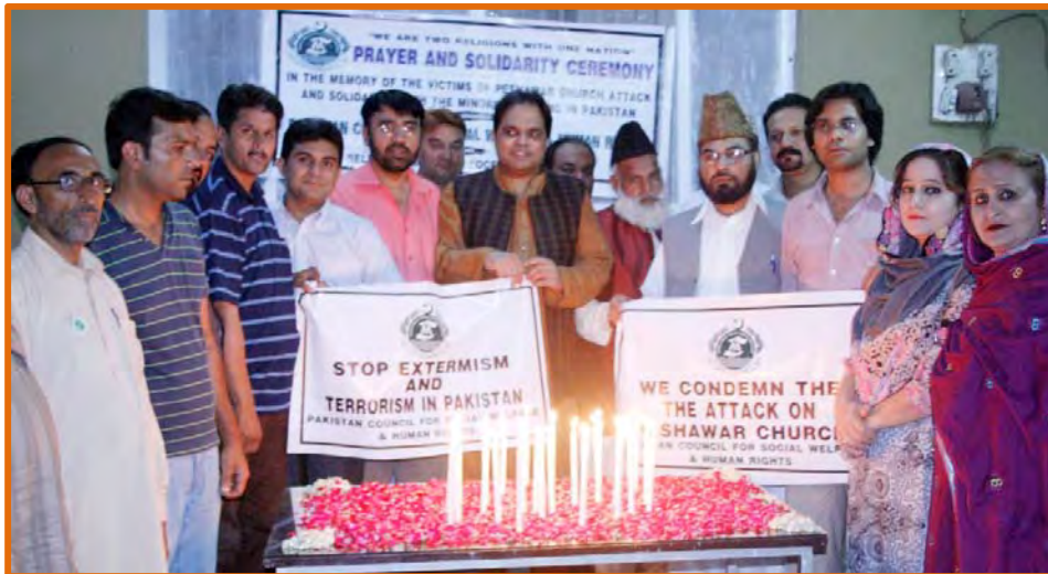
Candles are being lighting during the Prayers and Solidarity Ceremony

At the end of the ceremony candles were lighting in the memory of those innocent people died during the suicide attack at Church and also to show solidarity with the Christian community. Prayer was also offered for the departure soul of died people and prevailing of peace in Pakistan and throughout the world. The ceremony was published by the all National Newspapers and all TV channels highlighted this ceremony in their news bulletin.