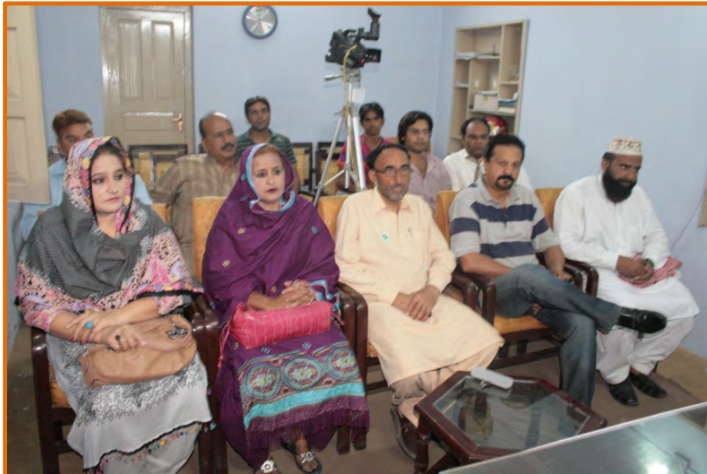
A view of speaker's Gallery during the ceremony

This shameful and brutal attack on the Church has united the whole Pakistani nation and this is good time to fight against the mindset of extremism and terrorism in Pakistan with the strengthen of mutual relations, equality and self respect of each other's and as well as to sensitize and motivate the Pakistan youth and students against the mindset of extremism and terrorism to create the culture of peace, equality, justice and human dignity & rights in Pakistan as well as at global level. The speakers of ceremony also said that we can only bring radical change with giving the proper guidance and counseling to the youth and student.